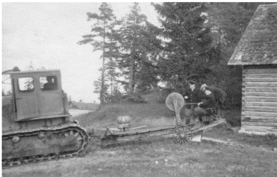
Sidest pannakse „grapi“ liini.