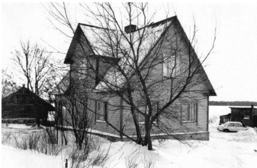
Kolhoosi „Murrang“ kontor. (1986. a.)

Antud tabel näitab, et kolhoosi astumise kõrgperiood oli 1949. aasta.