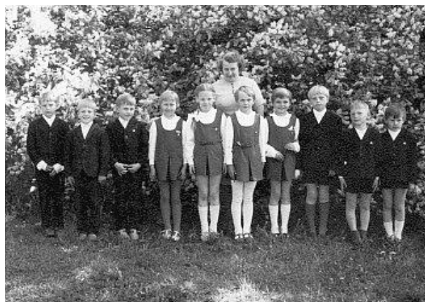
Esimese klassi lõpp 1973. a.

Et minu kodu oli Rasiveres ja külast Roela alevisse, kus asus kool, oli 7 km, sõitsin kooli bussiga. Hommikul viis buss meid kell 8.00 kooli, õhtul tõi 17.00 tagasi. Pärast