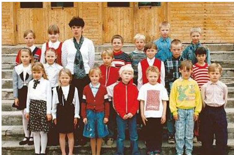
Hendrik Roela Põhikoolis 1997. a.

oli see, et õpetajal oli igäühe jaoks meist aega ja ta kunagi ei keeldunud mingit asja üle seletamast, kui midagi jäi arusaamatuks. Nii ei olnud mul üleminek ühest koolist teise raske ja varsti hakkaski hästi minema. Lugema õppisin ma Vinni lasteaias, aga see oli päris raske, sest just siis avastati mul silmahaigus. Mulle pandi mingeid silmatilku, mis muutsid kõik häguseks ja raske oli tähti näha. Emal ka ei olnud minuga aega palju tegelda, sest õde oli alles nii pisike, et tal pidi kogu aeg mähkmeid vahetama.