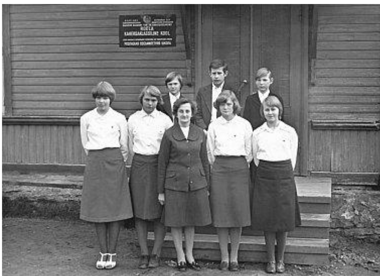
Mall Vanari 7. klassi õpilastega (paremalt esimene) 1978. a.

Aga jätkan kooliteemat. Kui minu isa maalis oma esimesi tähti sulega, oli minul täitesulepea, minu lastel omakorda tintenpenid. Arvuti asemel õppisin mina arveldamist arvelaua ja lükatiga. Keeltest oli minul põhirõhk eesti ja vene keelele, võõrkeeltele ei pandud nii suurt rõhku kui vene keelele. See ei tekitanud aga ei mulle ega mu vennale erilist raskust tänu meie emapoolsele vanaemale.