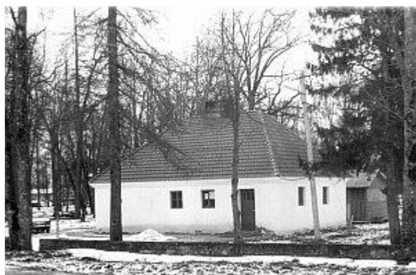
Saun-baar „SÄRTSU“ 1995. a.

Saun osteti 1994. a. „Roela Varahoidja“ käest. Saunas tehti põhjalik kapitaalremont. Hoones asub nüüd kaks saunaruumi, millest ühte köetakse puudega ja teist ruumi elektriga. Sauna saab kasutada ettetellimisega, milles märgitakse ära nädalapäev ja kellaaeg. Teenustasu ühe tunni eest on 24 krooni. Neljapäevane päev on saunakasutajatele soodustusega, siis peab ühe tunni eest tasuma 12 krooni. Seda võimalust kasutavad paljud elanikud. Põhilised kliendid on siis pensionärid ja paljulapselised pered. Saunas toimub ka toitlustamine. Sauna ametlik nimi on „Särtsu“ saun-baar. Klient saab tellida ka pool praadi, kui selleks soovi peaks olema. Ruum on väga meeldiv ja hubane. „Särtsu“ saun-baar töötab 1995. a. jaanuarist ja asub tiigi ääres pargis.