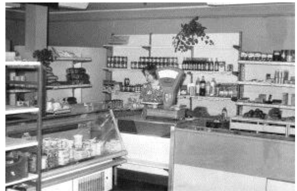
Müüja Sirje Väinaste 1995. a.