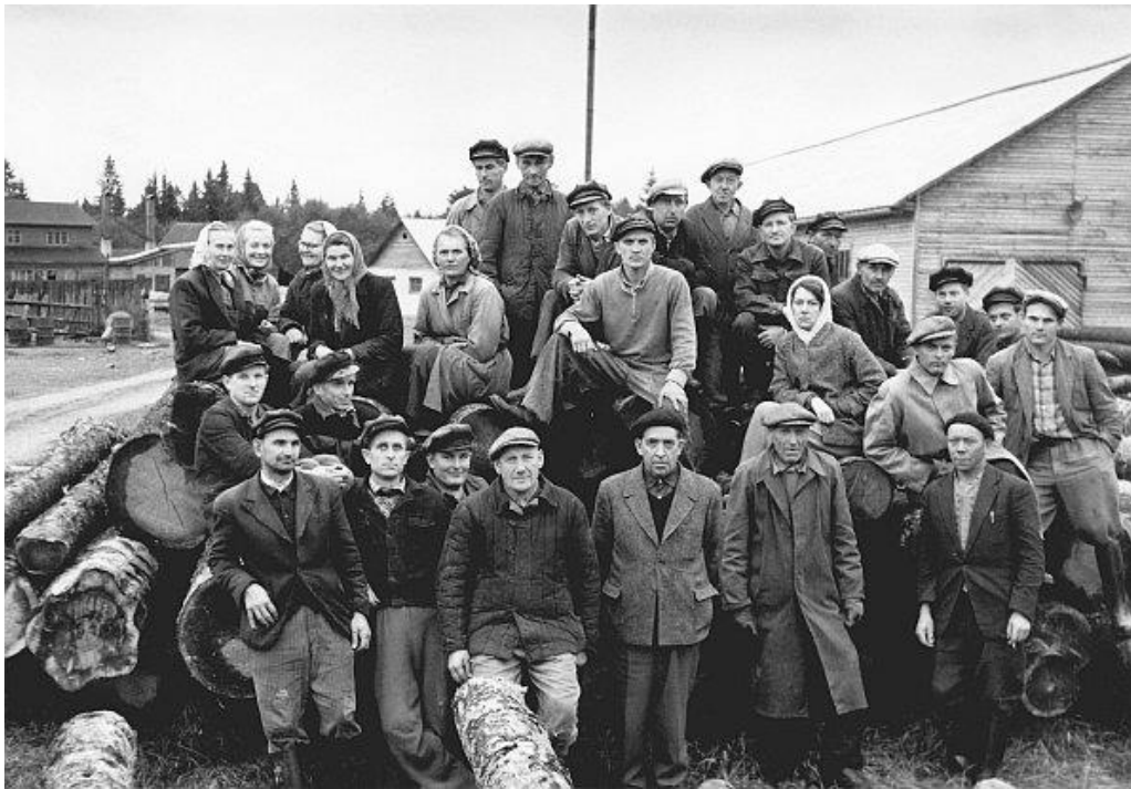
Rasivere puidutööstuse töölised 1960-ndatel.

Üldiselt võib ettevõtte tegevusega rahule jääda. Lähemateks ülesanneteks on välja vahetada vananenud masinad ja seadmed, et ka edaspidi vähemalt 30-le inimesele tööd kindlustada.