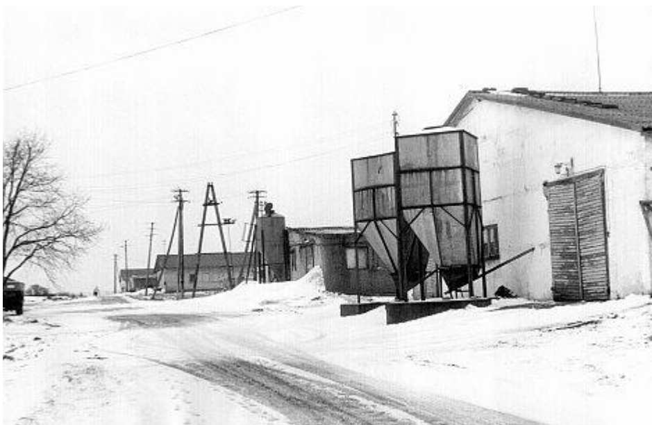
Kanalad 1995. a.

Aktsiaseltsi tööliste arv 1994. a. oli keskmiselt 34 inimest. Momendil on töökäigus viis kanalad. Eelmisel 1994. a. oli kanalates kokku keskmiselt 35 000 munejat kana, peale selle on igal aastal ka noorlindude kasvatamine. Kanatõugudeks on valge leghorn ja isa brown (tibud). Eelmise aasta munatoodang oli 4 812 000 tükki. Rahaliselt on laekunud, realiseerimise käive 2 895 000 krooni. Vähesel määral hautatakse ka tibusid Rakvere haudejaamas. Viimane asub Tõrmas. Tibud realiseeritakse elanikele aprillist kuni juulini.