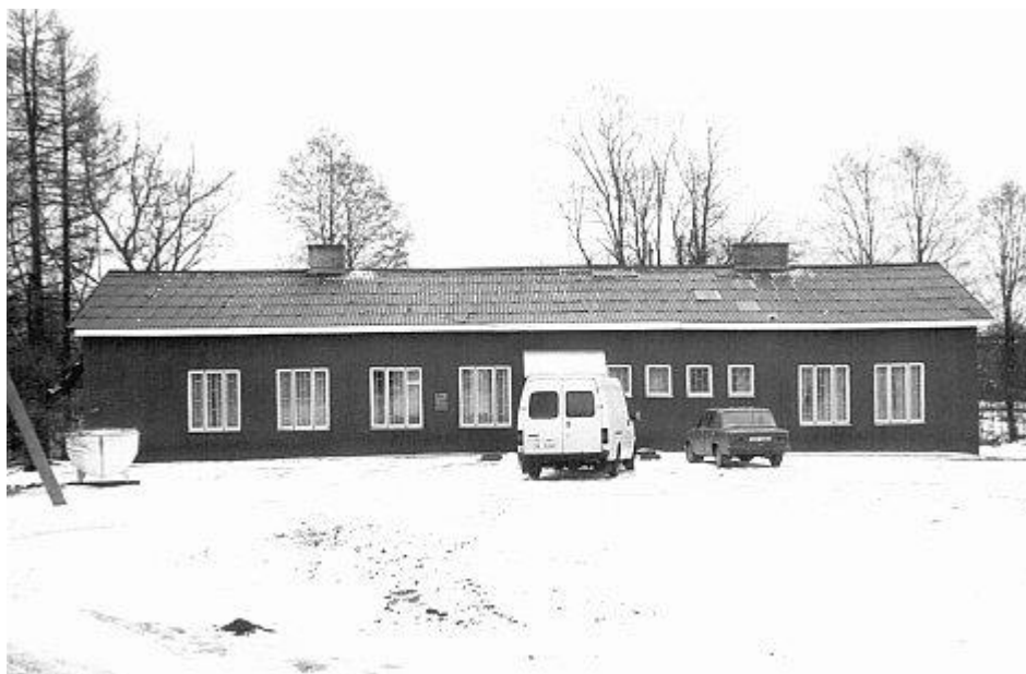
A/S RVF kauplus „Marex“ 1995. a.

Mõlemaid kultuure kasvatati realiseerimiseks. Firma realiseerimise käibeks oli 120 tuhat krooni.