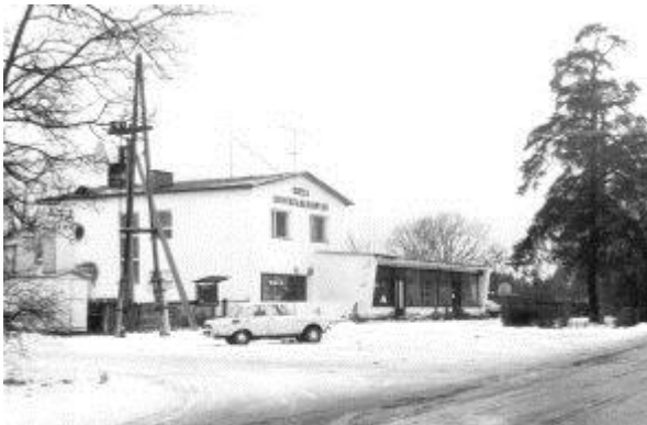
A/S „Seder“ kauplus 1995. a.

Ettevõtte püüab arendada esmatarbekaubandust.