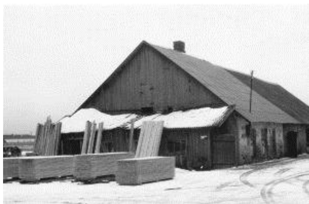
Puidutöökoda 1995. a.

Aktsiaseltsi vara, mis moodustab 55 495 krooni, on kaetud tööliste osakutega.