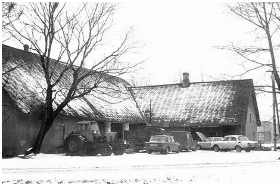
Elektrikute töökoda 1995. a.

Ettevõtte 1994. a. realiseerimisekäive oli kokku 987 tuhat krooni.