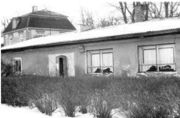
A/S „ATE“ kauplus 1995. a.

Kaupluse ühe kuu läbimüük on keskmiselt 90 000 EEK.